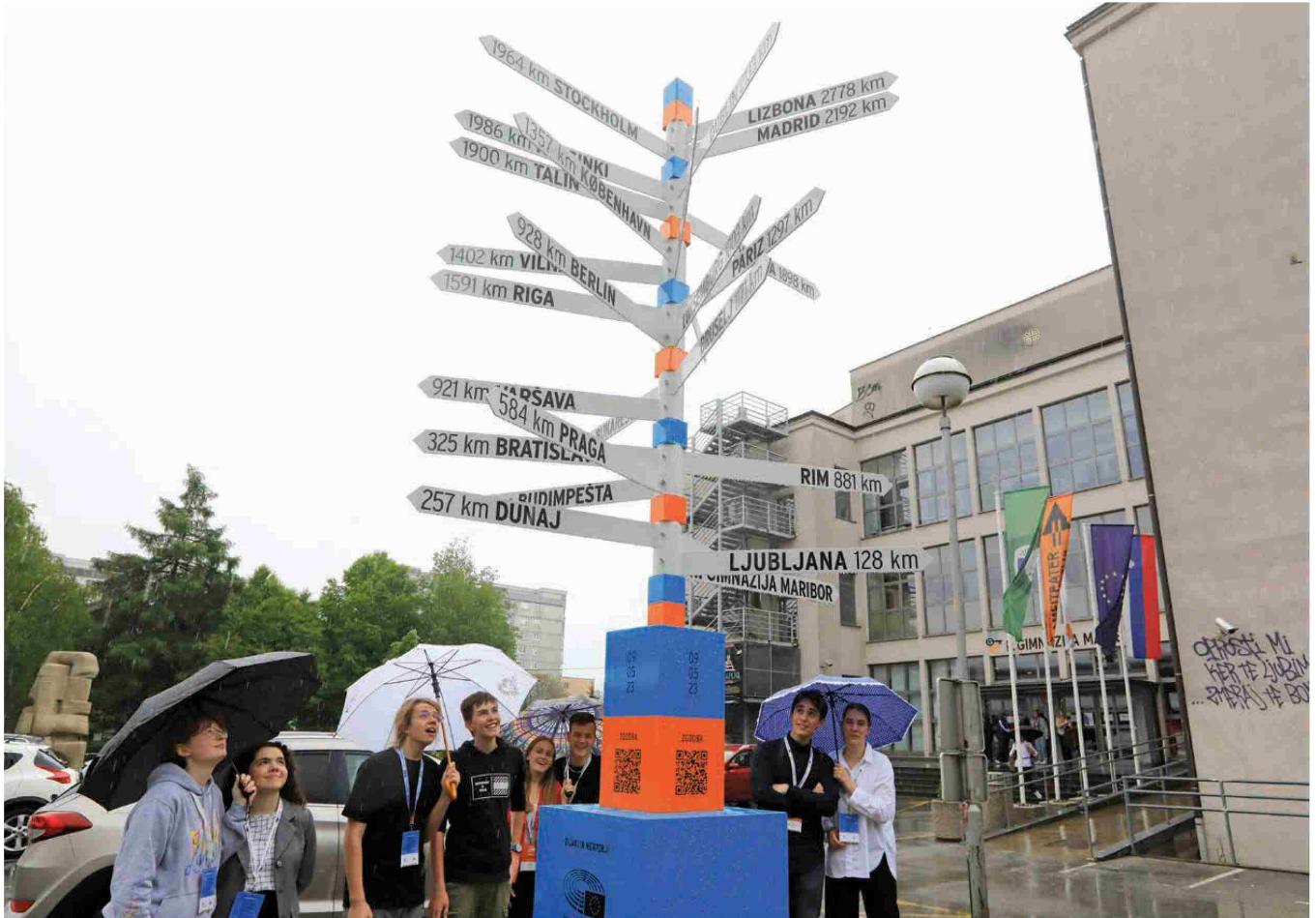
Kažipot, ki so ga lani postavili ob II. gimnaziji, usmerja v evropska mesta in opozarja na njihovo oddaljenost, hkrati pa je simbol, ki mlade usmerja na različne možnosti, ki jih ponujata Evropa in svet.

Objave so namenjene interni uporabi v skladu z odločbami ZASP in se brez soglasja imenitnika pravice ne smejo prosbo razmnoževati in distribuirati!