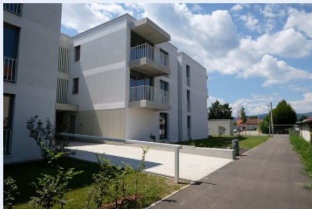
Socialna stanovanja v Mariboru.

Slovenija bo iz programa NextGenerationEU prejela 23 milijonov evrov za gradnjo 400 novih stanovanjskih enot v Mariboru . Projekt, ki ga vodi Stanovanjski sklad RS, želi zmanjšati visoke stroške stanovanj z zagotavljanjem cenovno dostopnih stanovanj za ranljive skupine. Pobuda daje prednost družbeni vključenosti in izboljšanju življenjskega standarda ter tako dokazuje zavezanost Evropske unije k podpori skupnosti in spodbujanju svetlejše prihodnosti za Slovenijo.