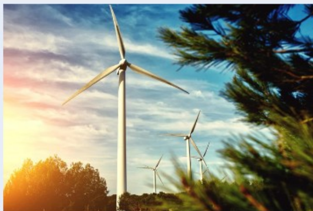
Slovenija bo z evropskimi sredstvi zmanjšala odvisnost od ruske energije.

Slovenija je že prejela 24 milijonov evrov evropskih sredstev za izvajanje ukrepov REPowerEU , s katerimi bo zmanjšala odvisnost od ruske fosilne energije. Skupni paket v višini 122 milijonov evrov je namenjen krepitvi električnega omrežja, povečanju energetske učinkovitosti in spodbujanju obnovljivih virov energije. Zakonodajne reforme in strateške naložbe, vključno s