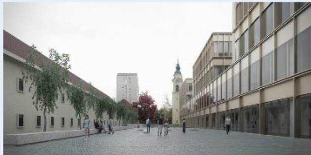
Kampus Vrazov trg, Medicinska fakulteta Univerze v Ljubljani.

Pobuda za nov kampus Medicinske fakultete Univerze v Ljubljani na Vrazovem trgu si prizadeva zagotoviti boljši dostop do kakovostne zdravstvene oskrbe, kar bo izboljšalo splošno blaginjo prebivalstva.