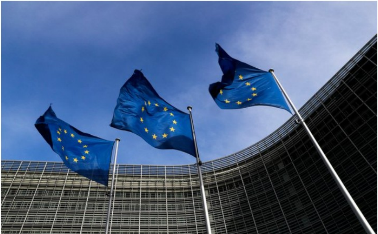
Sedež Evropske komisije v Bruslju.

Komisija pod vodstvom predsednice Ursule von der Leyen se od leta 2019 uspešno spopada z izzivi, izkazuje trdno zavezanost drznosti in ambicioznosti ter si prizadeva za močnejšo in odpornejšo Evropsko unijo. Njen proaktivni pristop je ključen pri spopadanju s pandemijo covida-19, podnebnimi spremembami in geopolitičnimi napetostmi.