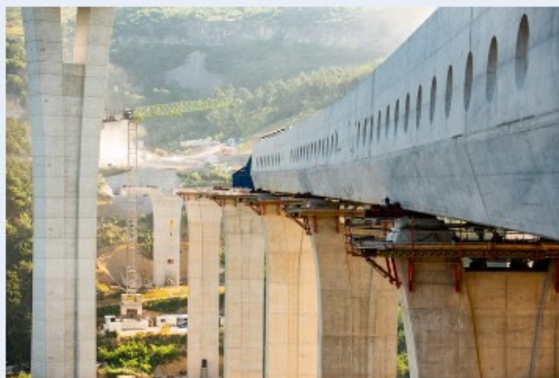
Viadukt Gabrovica v dolžino meri 416 metrov.

Z dokončanjem drugega tira železniške proge Divača–Koper se obeta spodbuda rasti ključnih sektorjev slovenskega gospodarstva, saj bo omogočil boljšo povezanost in hitrejši gospodarski razvoj. Cilj projekta, ki je v okviru instrumenta za povezovanje Evrope prejel 167,5 milijona evrov, je razbremeniti obstoječo infrastrukturo, zlasti Luko Koper, ter povečati njeno kapaciteto in konkurenčnost v svetovnem merilu.