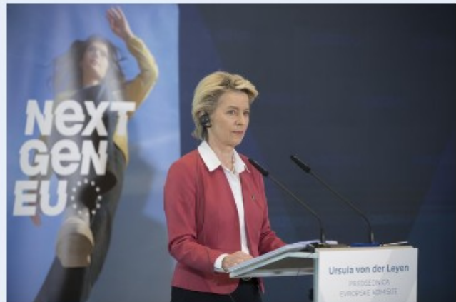
Naložbe v zdravstvo, inovacije in cenovno dostopna stanovanja potrjujejo zavezanost Slovenije krepitvi gospodarske in družbene odpornosti ter zagotavljanju svetlejši in bolj trajnostne prihodnosti (Ursula von der Leyen na Brdu).

Izbrane projekte NextGenerationEU v Sloveniji si lahko ogledate na zemljevidu .