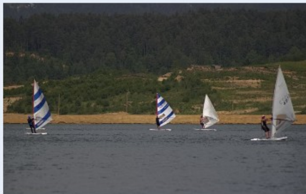
Jadranje na Velenjskem jezeru.

Evropski Sklad za pravični prehod (Just Transition Fund) bo Savinjsko-šaleški regiji (SAŠA) in Zasavju, ki sta precej odvisna od fosilnih goriv, namenil 258 milijonov evrov za prehod v zeleno gospodarstvo, od česar bodo imele lokalne skupnosti neposredno korist. Naložbe se osredotočajo na diverzifikacijo gospodarstva, nadgradnjo infrastrukture za čisto energijo in usposabljanje 2400 delavcev za prehod iz premogovniškega sektorja.